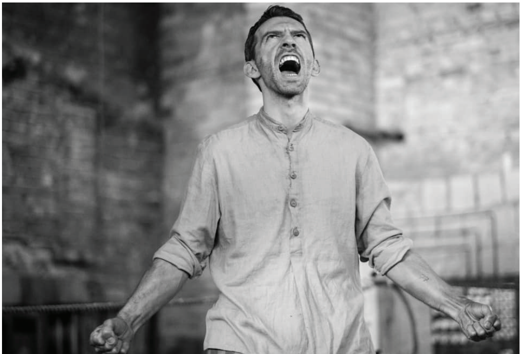
FOTO: Piotr Głowacki jako Tadeusz Pietrzykowski w filmie „Mistrz”. Materiały dystrybutora Galapagos.