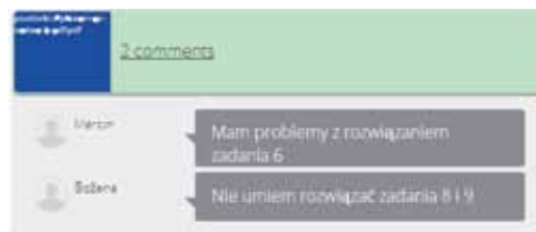
Rys. 4. Widok informacji zwrotnej od uczniów w menu Comments

Jeżeli był to zestaw materiałów przygotowany do odwróconej lekcji, nauczyciel już wie, jak przygotować się do zajęć w klasie, które zagadnienia z lekcji powtórzyć lub zrealizować od podstaw, o czym podyskutować z uczniami, dysponuje informacją, kto z klasy rzetelnie wykonał jego polecenie, a kto się nie przyłożył.