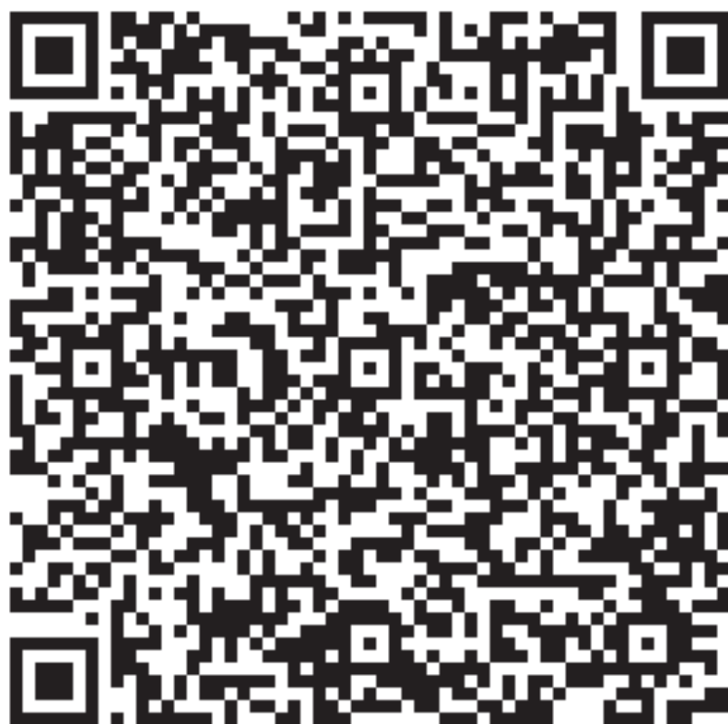
Rysunek 2. Kody QR kierujące do ankiety ( http://tnij.org/meritum365an ) i wyników ankiety ( http://tnij.org/meritum365anw )