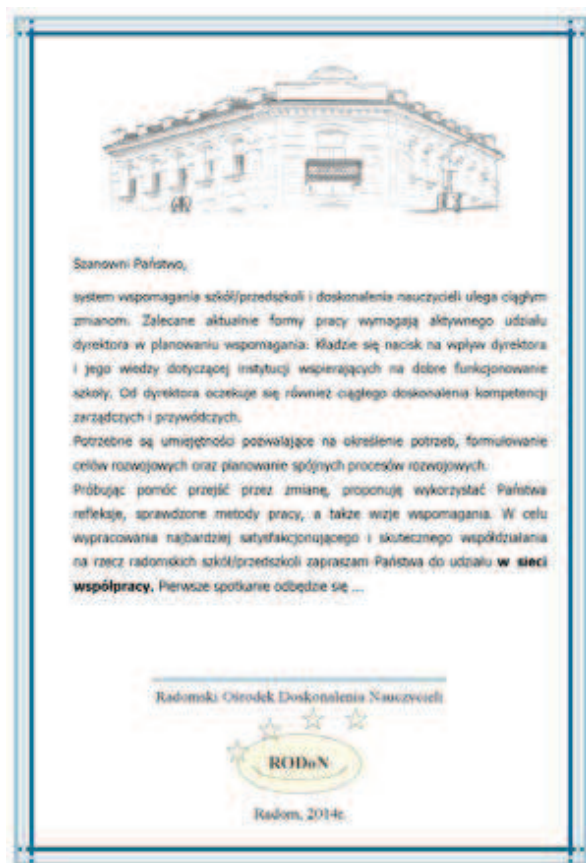
Rysunek 1. Zaproszenie dyrektorów do udziału w sieci współpracy

RODoN inicjuje również aktywność w sieciach współpracy i samokształcenia o charakterze interdyscyplinarnym, skupionych wokół konkretnego tematu. W czasie spotkań stwarzane są warunki sprzyjające dzieleniu się wiedzą i umiejętnościami, a także zespołowemu poszukiwaniu sposobów realizacji zadań. Jest to proces, w którym doradca metodyczny zmienia swą rolę z eksperta w danej dziedzinie na koordynatora sieci. Zaproszenie do działalności w sieci zajmującej się zaproponowaną przez doradcę metodycznego tematyką zaowocowało powstaniem kilku aktywnych grup nauczycieli, wicedyrektorów i dyrektorów.