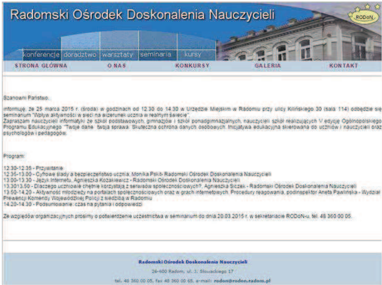
Rysunek 6. Informacja o seminarium na stronie www.rodon.radom.pl