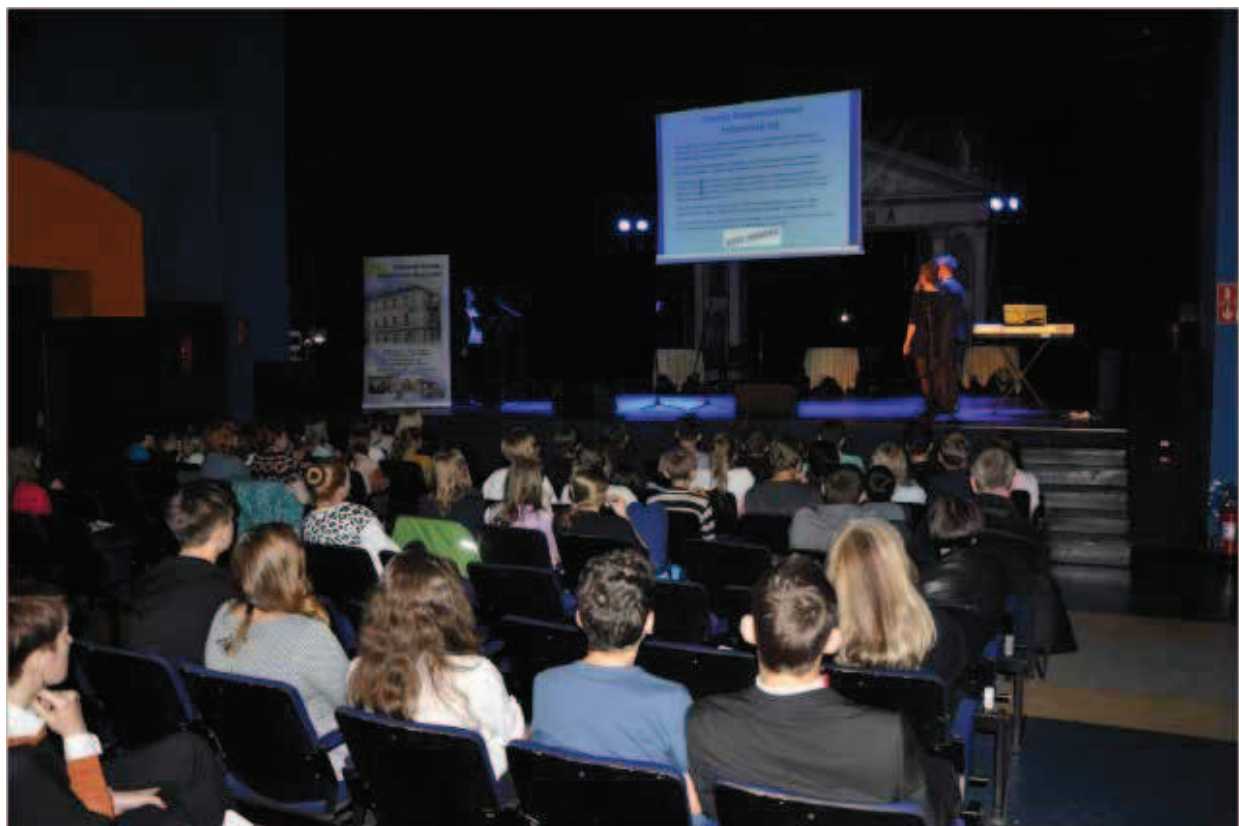
Rysunek 7. Festiwal wiedzy na temat ochrony danych osobowych