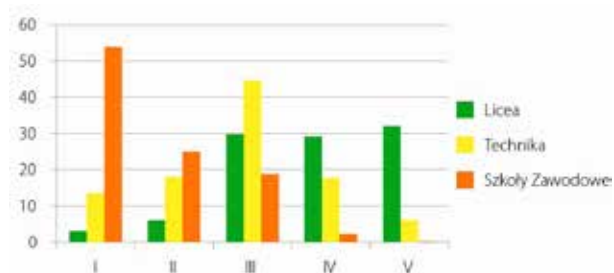
Wykres 2. Umiejętności historyczne uczniów na początku 1 i 2 klasy szkół ponadgimnazjalnych

o bardzo podstawowych kompetencjach historycznych – ponad 50% uczniów z takich placówek radzi sobie wyłącznie z najmniej wymagającymi zadaniami z historii. Dalsze 40% uczniów zasadniczych szkół zawodowych posiada umiejętności z poziomu drugiego i trzeciego, a jedynie niespełna 5% osiągnęło jeden z dwóch najwyższych stopni umiejętności. Wyraźnie inaczej wygląda sytuacja w technikach. W tym wypadku dostrzegalny jest w istocie niemal regularny rozkład badanej cechy w populacji, przy czym godny podkreślenia wydaje się nie tylko stosunkowo mały odsetek osób o najniższych umiejętnościach, ale również zauważalny procent uczniów o wysokich kompetencjach historycznych (blisko 20% na poziomie czwartym, przeszło 5% na poziomie piątym). W przypadku licealistów istotne wydaje się przede wszystkim – omówione już wyżej – duże zróżnicowanie ich umiejętności historycznych przy jednoczesnej wyraźnej dominacji osób na wyższych poziomach umiejętności: blisko 60% z nich znalazło się na dwóch najwyższych poziomach, następne 30% osiągnęło poziom trzeci.