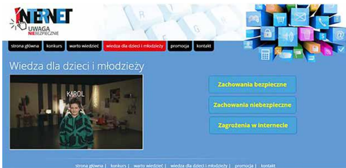
Rysunek 1. Widok strony projektu „Internet – uwaga niebezpiecznie”

Ze strony projektu, przygotowanej w całości w języku migowym, można dowiedzieć się m.in.: