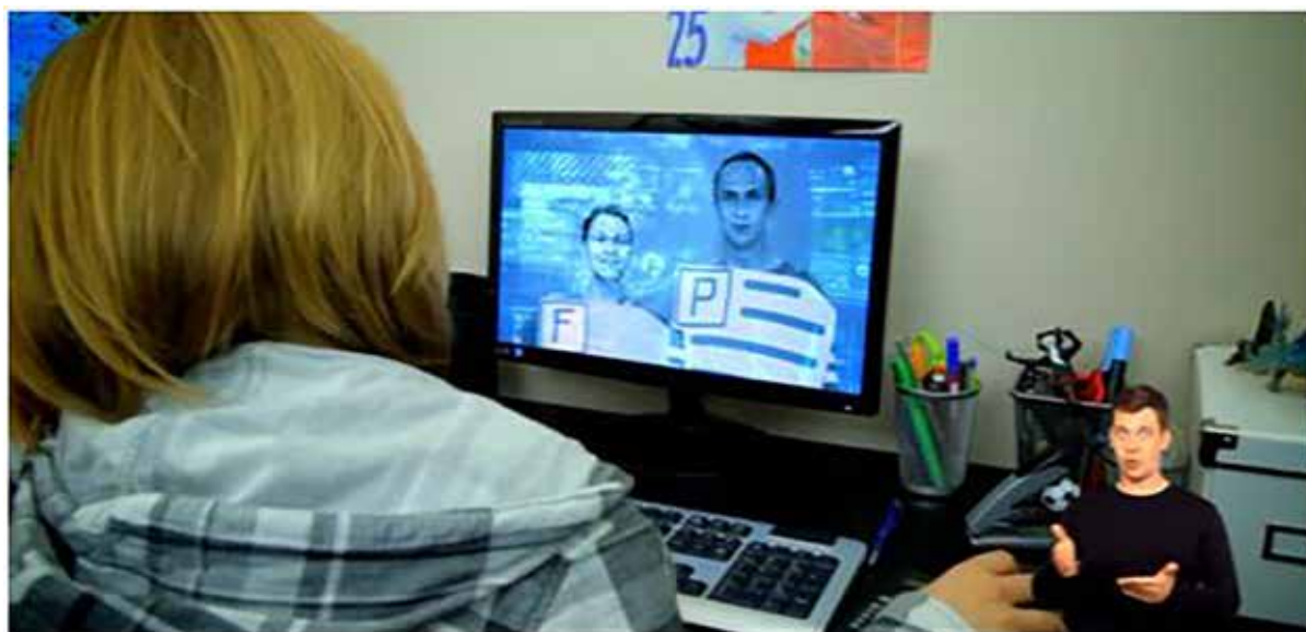
Rysunek 6. Kadr z filmu „Fajna zabawa, ale...”