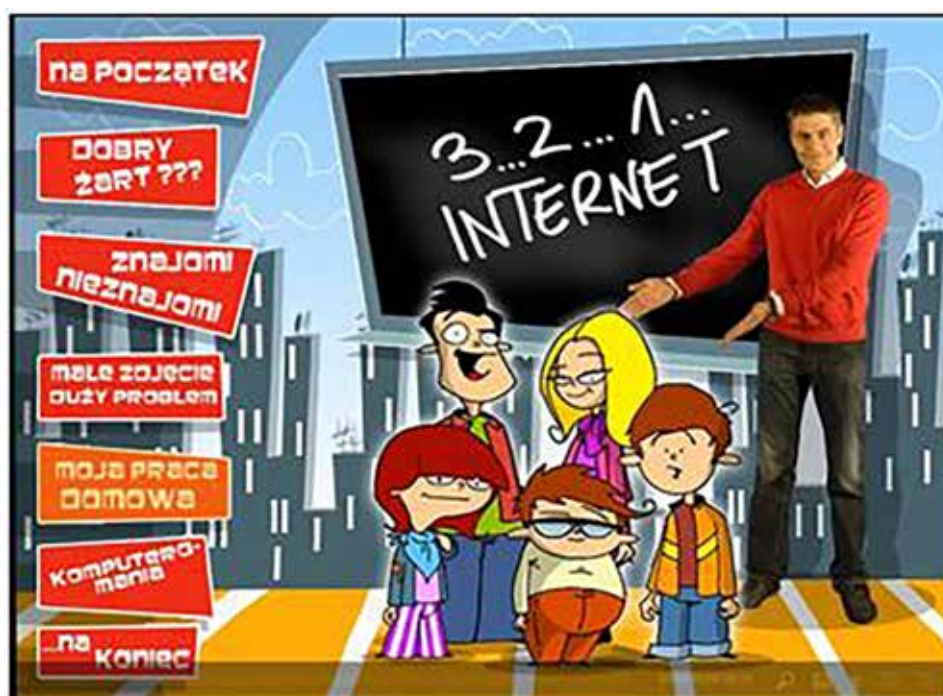
Rysunek 4. Strona startowa pakietu „3... 2... 1... Internet! w wersji migowej”