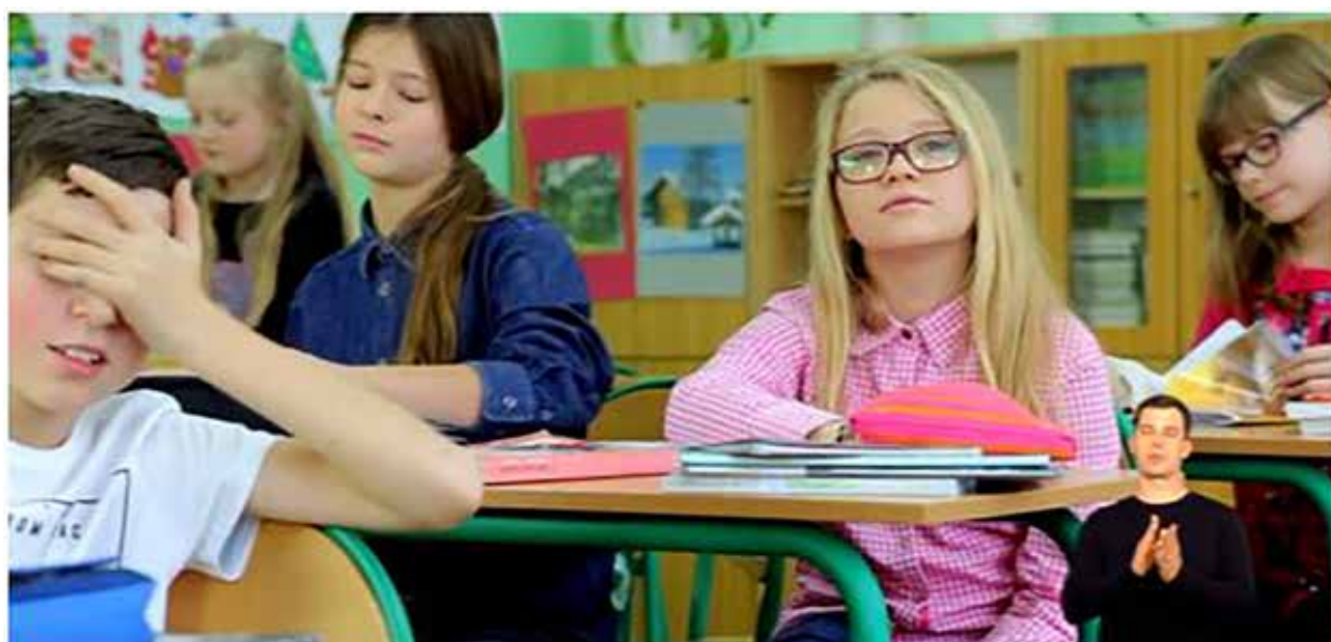
Rysunek 7. Kadr z filmu „Nie ufaj bezgranicznie sieci”