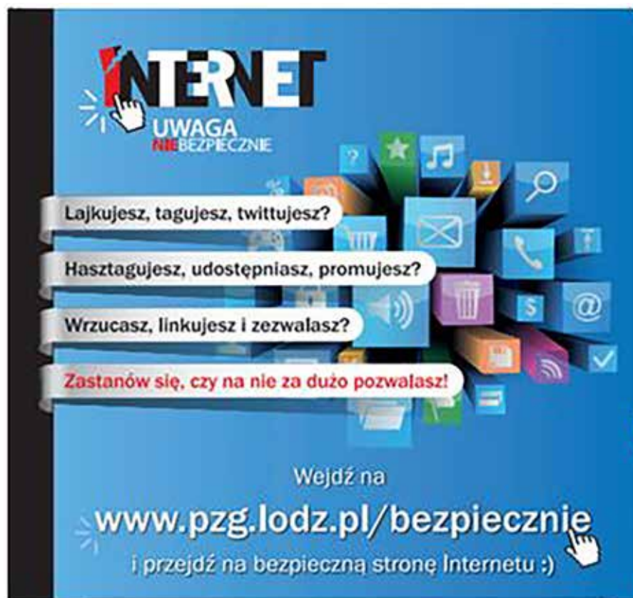
Rysunek 2. Plakat promujący projekt „Internet – Uwaga niebezpiecznie”

Jury konkursu tak uzasadniało swoje decyzje: Wszystkie prace były fantastyczne, widać w nich było zaangażowanie i przemyślenia na temat bezpieczeństwa w Internecie. Niektóre filmy wywarły na jurorach ogromne wrażenie, niektóre wzbudziły zachwyt i poruszenie. Ale wszystkie dały ogromną energię oglądającym, wywołały uznanie i szacunek za ogrom pracy włożony w przygotowanie filmów.